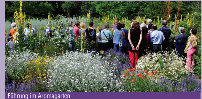
Führung im Aromagarten

Führungen Von April bis Oktober finden öffentliche thematische Gartenführungen statt, bei denen einzelne Pflanzen, aber auch die Inhaltsstoffe und ihre (Heil-)Wirkung vorgestellt werden. Auf Wunsch können individuelle Führungen für Gruppen und Schulklassen unter www.botanischer-garten.fau.de/fuehrungen gebucht werden.