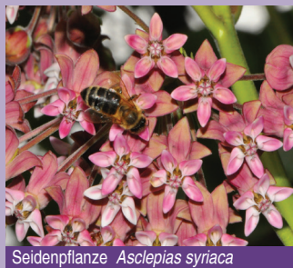
Seidenpflanze Asclepias syriaca

m 2 sind heute ca. 120 heimische und exotische Duft- und Aromapflanzen zu finden. Besucher des Aromagartens haben so die Möglichkeit, eine faszinierende Palette ausgesuchter Aromapflanzen kennenzulernen. Dabei erstaunt die Vielfalt der Duftnuancen, die jeder individuell für sich entdecken kann.