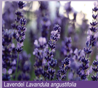
Lavendel Lavandula angustifolia

Immer der Nase nach Betritt man den Aromagarten, befindet man sich unversehens in einer Welt voller Wohlgeruch und optischer Reize. Während Farben und Formen in Bildern wiedergegeben werden können, sind Düfte als sinnliches Erlebnis etwas Vergängliches. Sie müssen immer wieder neu wahrgenommen werden und machen den besonderen Reiz des Gartens an der Palmsanlage aus. Neben dem charakteristischen Geruch wur-