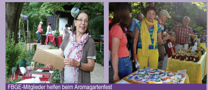
FBGE-Mitglieder helfen beim Aromagartenfest