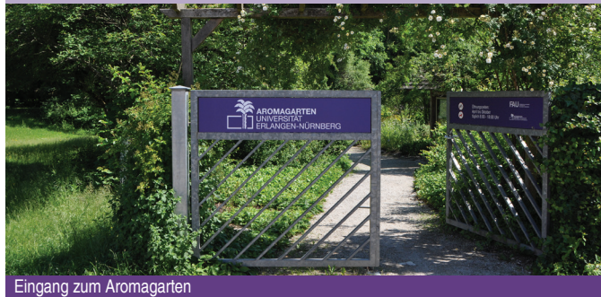
Eingang zum Aromagarten

Der Aromagarten in Erlangen liegt im Landschaftsschutzgebiet des Schwabachgrundes östlich der Erlanger Innenstadt, nur 15 Gehminuten vom Botanischen Garten entfernt. Seit seiner Entstehung 1981 hat sich sein Erscheinungsbild immer wieder verändert. In den letzten Jahre konnten so sorgfältig ausgewählte Duftpflanzen ergänzt, neue Pflegekonzepte entwickelt und das Angebot der Führungen weiter ausgebaut werden.