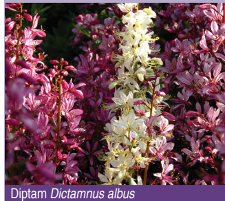
Diptam Dictamnus albus

Er gehört zur Friedrich-Alexander-Universität und wird vom Botanischen Garten betreut und gepflegt. Alle Pflanzen müssen mit den oft extremen, meist sehr trockenen Bedingungen im Garten auskommen. Auf chemischen Pflanzenschutz und eine dauerhafte Bewässerung wird verzichtet. Auf einer Fläche von rund 9.000