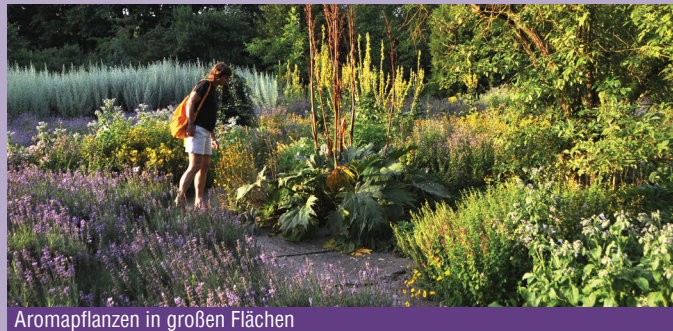
Aromapflanzen in großen Flächen

de bei der Auswahl der Pflanzen Wert darauf gelegt, möglichst interessante, ausdauernde Arten auszuwählen, die einen hohen Gehalt verschiedener Wirkstoffe haben. Aus diesem Grund bietet sich dem Besucher ein Geruchserlebnis der ganz besonderen Art: Durch die großflächige Pflanzung vieler Exemplare einer Pflanzenart wird der Duft der einzelnen Pflanzen verstärkt und kann so noch intensiver wahrgenommen werden.