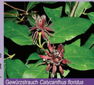
Gewürzstrauch Calycanthus floridus

de bei der Auswahl der Pflanzen Wert darauf gelegt, möglichst interessante, ausdauernde Arten auszuwählen, die einen hohen Gehalt verschiedener Wirkstoffe haben. Aus diesem Grund bietet sich dem Besucher ein Geruchserlebnis der ganz besonderen Art: Durch die großflächige Pflanzung vieler Exemplare einer Pflanzenart wird der Duft der einzelnen Pflanzen verstärkt und kann so noch intensiver wahrgenommen werden.