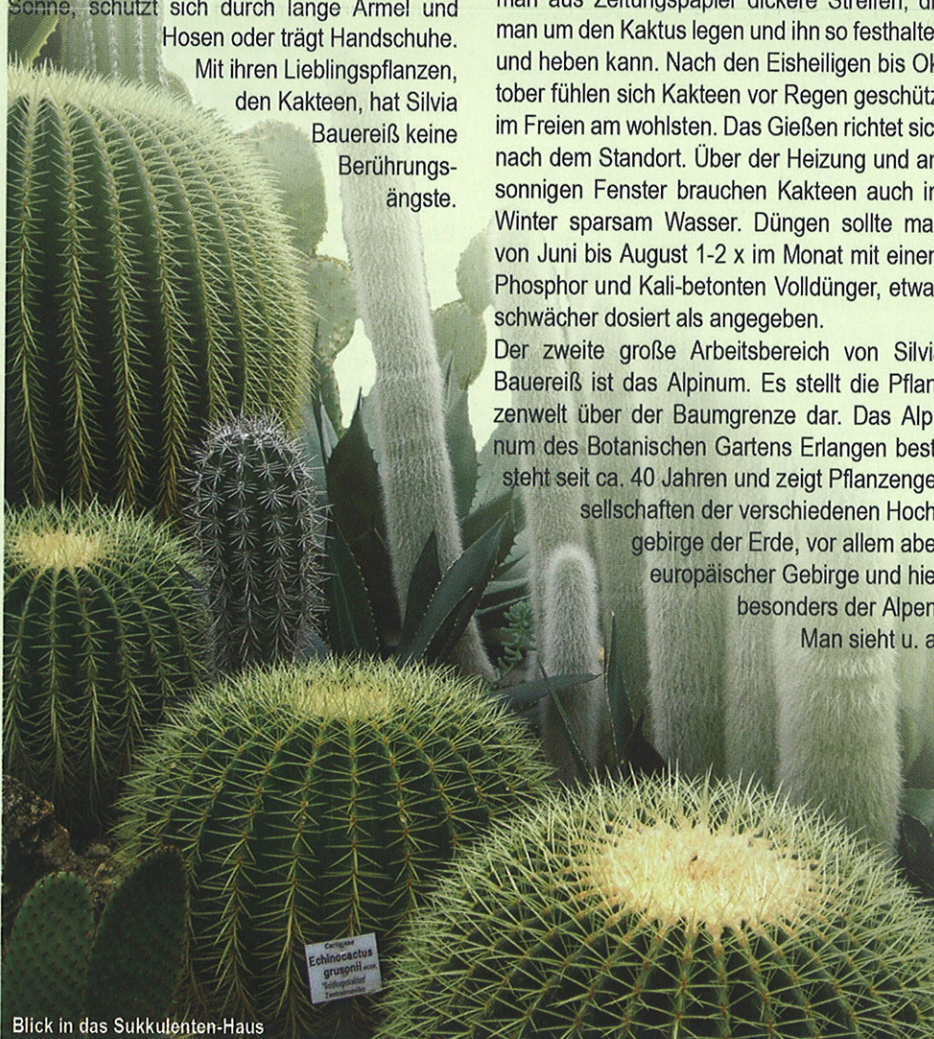
Original Echinocactus grusonii

Aber sobald das erste Grün aus der Erde spitzt, zieht es Silvia Bauereiß wieder nach draußen. Auch in ihrer Freizeit pflegt sie mit Leidenschaft einen Teil der Grünanlage des Mietshauses, in dem sie mit ihren beiden Töchtern (16 und 20 Jahre alt), 6 Kanarienvögeln und vielen Kakteen lebt. Sie kocht mit Vergnügen, - auch für andere, was die Kollegen bei Feiern besonders zu schätzen wissen. Außerdem liest sie gerne, geht walken oder faulenz auf dem Balkon. Zwei mal im Jahr steht ein großes Treffen mit ihren 9 Geschwistern samt Familien an. Sie ist glücklich über ihre große Verwandtschaft: „Es immer einer da, wenn man jemanden braucht, man ist nie alleine.“ Sie reist gerne ans Meer und von einem Lottogewinn würde sie sich ein Haus mit Garten kaufen. Denn ihren Traumberuf möchte sie nicht aufgeben. c.w.