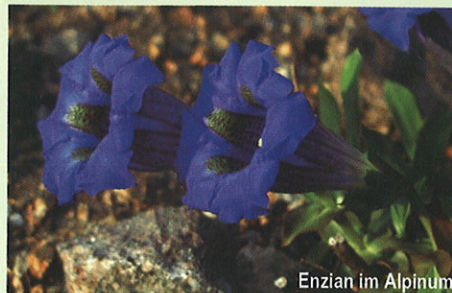
Enzian im Alpinum

Vor 6 Jahren übernahm sie die Verantwortung für das Kakteenhaus, das eine Vielzahl von Pflanzen extremer Trockengebiete, die so genannten sukkulenten Pflanzen beherbergt. Sie haben spezielle Wasserspeichergewebe gebildet, um lange Dürrezeiten zu überstehen. Als Besonderheiten der Sammlung nennt Silvia Bauereiß die großen, schon über 150 Jahre alten Schwiegermutteressel ( Echinocactus grusonii ). Auch eine Besonderheit ist das Substrat, in dem die Pflanzen so gut gedeihen: eine Mischung aus abgelagertem, gedämpftem Kompost, Landerde, Lehm, Sand, Torf, Granitsplitt, Steinmehl und gebrochenem Blähton. Für Kakteenliebhaber hat Silvia Bauereiß folgende Tipps: fertig gekaufte Kakteen Erde besteht zum Großteil aus Torf, deshalb sollte man sie nicht pur verwenden, sondern mit mineralischem Gesteinssplitt, Sand und Blähton