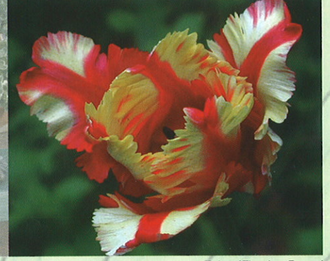
Tulpe 'Flaming Parrot'

Unsere Öffnungszeiten: Freiland tägl. 8.00 - 16.00 Uhr, Juni bis August tägl. bis 17.30 Uhr, Gewächshäuser Di - So 9.30 - 15.30 Uhr Anfahrt zum Botanischen Garten, Loschgestr. 3, 91054 Erlangen: A73, Ausfahrt Erlangen-Nord, folgen Sie den Wegweisern Theater. Parkmöglichkeit am Theaterplatz. 5 Gehminuten vom Bahnhof oder Bushaltestelle Hugenottenplatz.