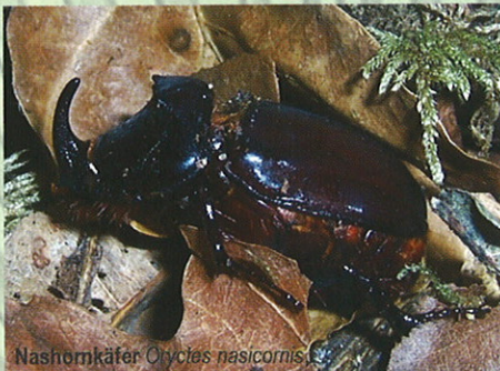
Nashornkäfer Oryctes nasicornis

Bei den Tieren, von denen hier die Rede ist, tragen tatsächlich die Männchen ein imponantes Horn auf der „Nase“, krabbeln auf 6 Beinen und können sogar fliegen. Es handelt sich um den Oryctes nasicornis L., einen Verwandten von Mai-, Juni-, Mist- und Rosenkäfer, der erst in den letzten Jahren, immer im Spätfrühling, im Botanischen Garten auftauchte. Sein gedrungener Körper wird bis 4 cm lang, die Oberseite glänzt kastanienbraun und er ist seitlich fuchsrötlich behaart.