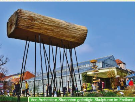
Von Architektur-Studenten gefertigte Skulpturen im Freiland