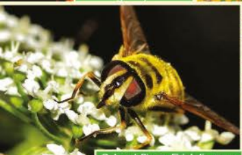
Schwebfliege Eristalis spec.