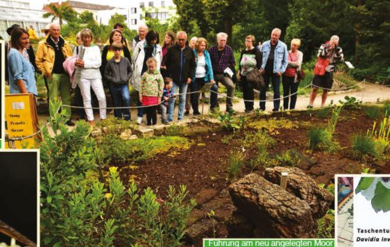
Führung am neu angelegten Moor