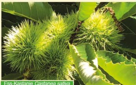
Ess-Kastanie Castanea sativa

Als Ergänzung zu der vergangenen Esskastanienausstellung bietet der Freundeskreis des Botanischen Gartens eine Exkursion zu einer der höchsten Esskastanien Bayerns und dem zweitgrößten