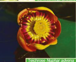
Teichrose Nuphar advena