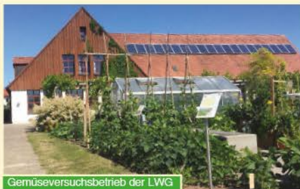
Gemüseversuchsbetrieb der LWG

Bamberg zählt nicht nur mit seiner Gärtnerstadt zum Weltkulturerbe, sondern hat auch einige weitere gärtnerischen Aspekte zu bieten. So befindet sich südlich von Bamberg am Hain ein moderner Gemüseversuchsbetrieb der Landesanstalt für Wein- und Gartenbau (LWG). Dort werden nach Bio-richtlinien aktuelle Versuche zum Anbau von Gemüse im Freiland und unter Glas durch-