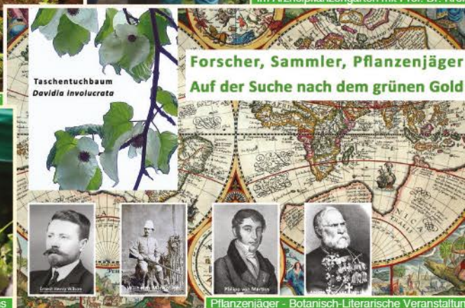
Taschentuchbaum Davidia involucrata