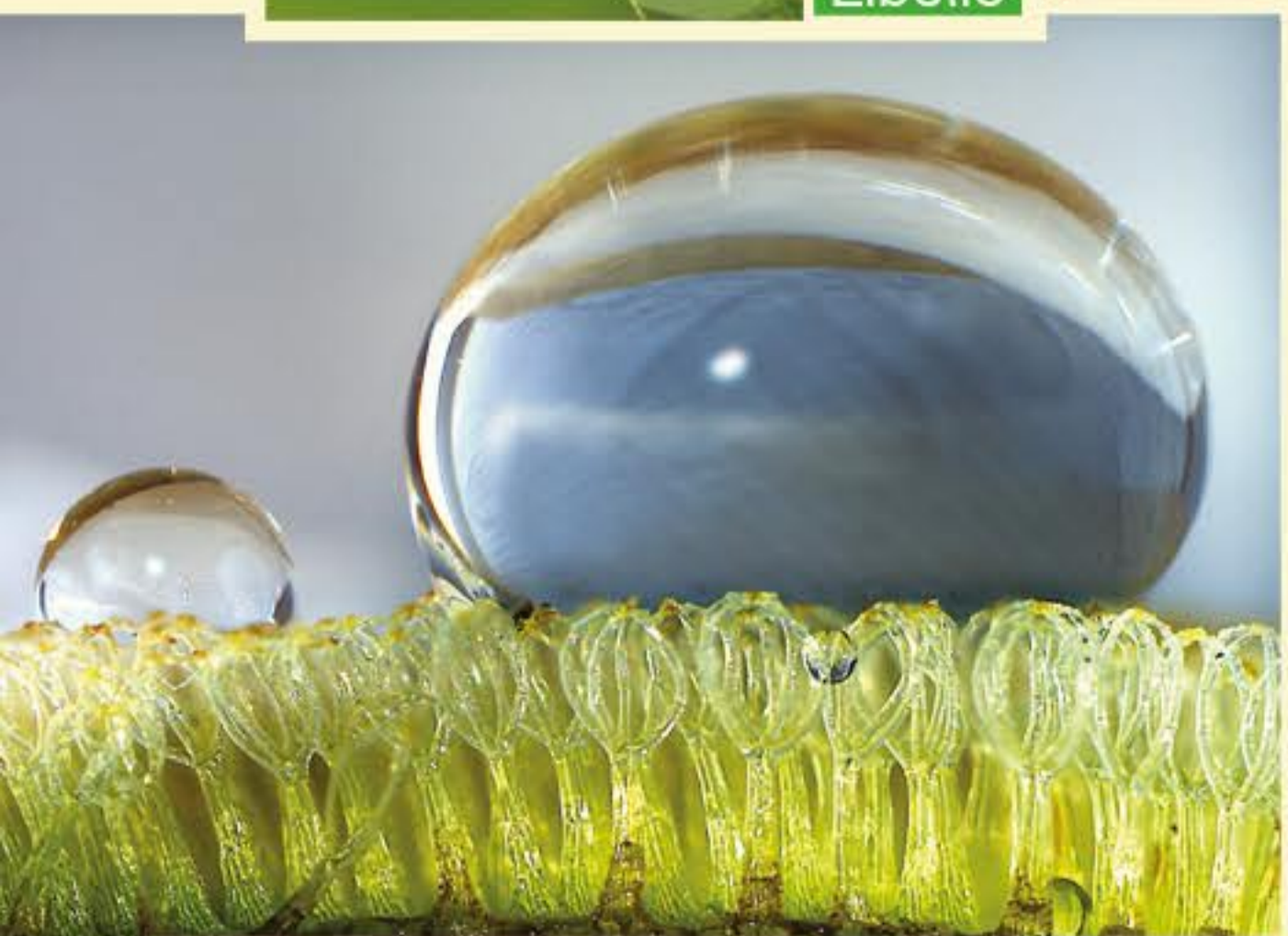
Schwimmfarn Salvinia