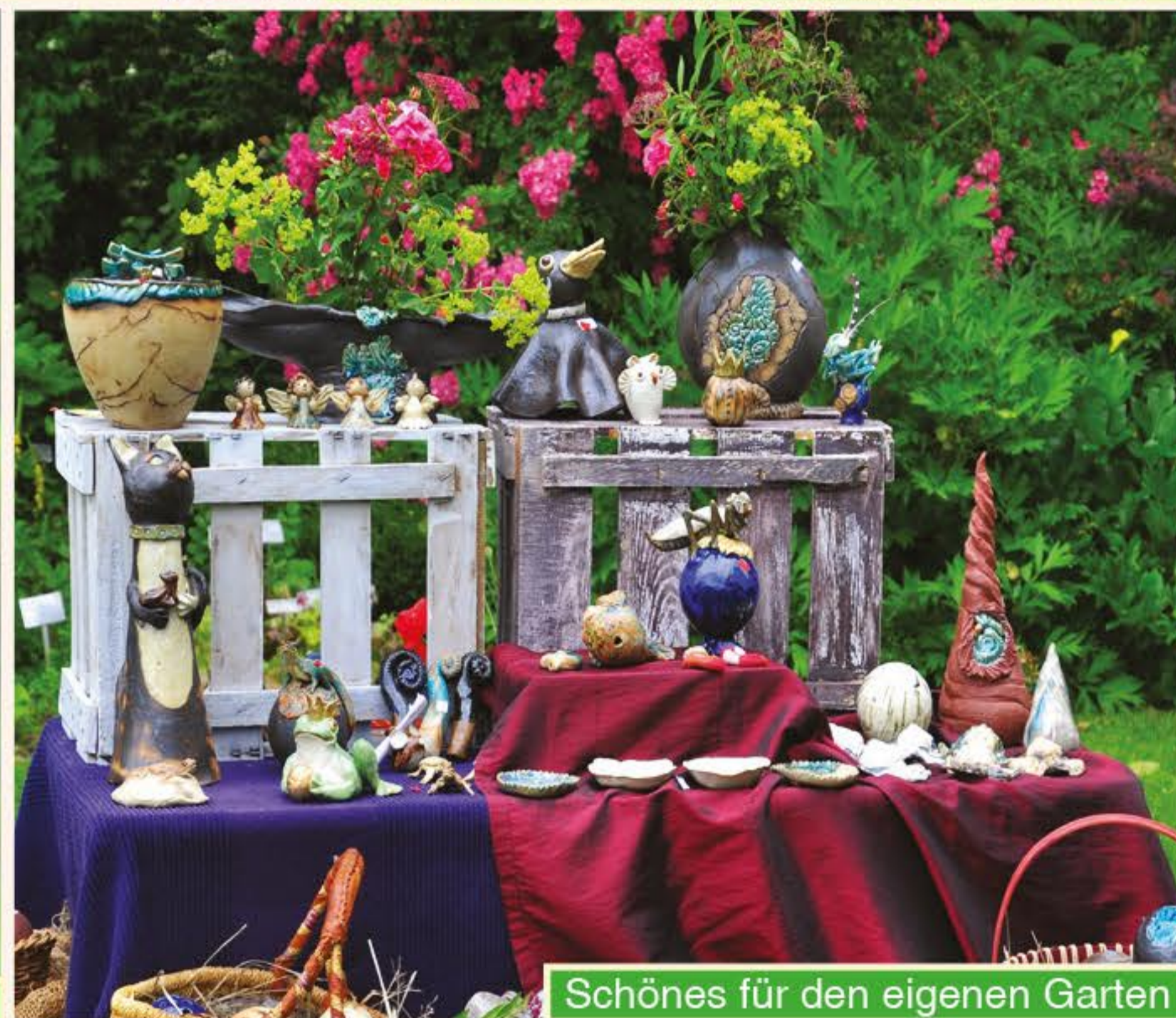
Schönes für den eigenen Garten