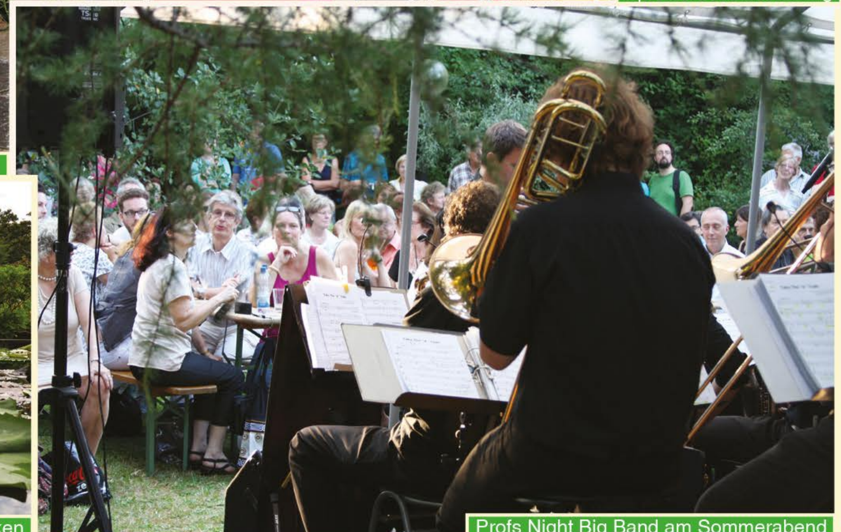
Prof's Night Big Band am Sommerabend