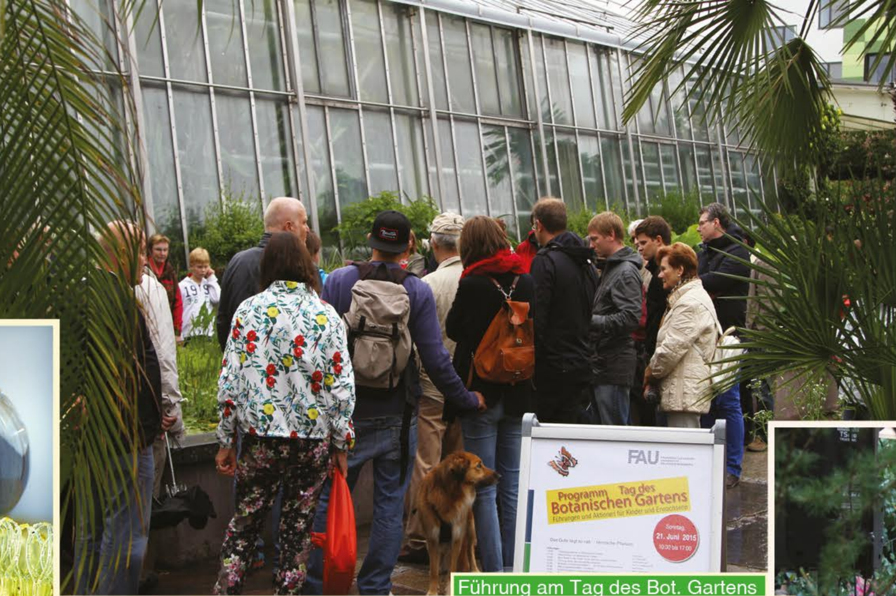
Führung am Tag des Bot. Gartens